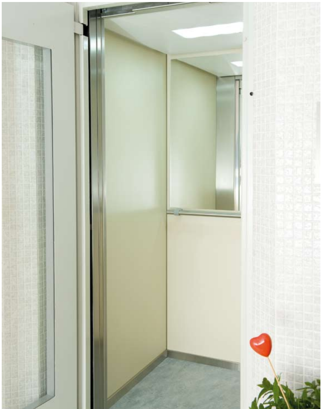
Wand hellbeige, Boden grau, Spiegel, Handlauf, Sockelleiste