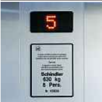
Digitaler Anzeiger im Kabinentableau