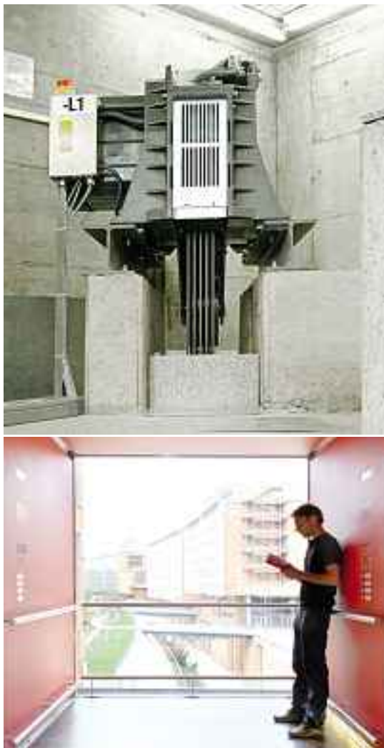
Komfort und Ruhe bei jeder Fahrt.